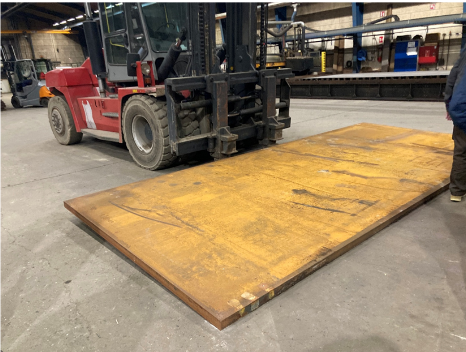
Der skal virkelig løfte-kræfter til en sådan stålplade