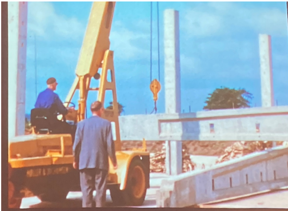
Der opføres fabrikshal