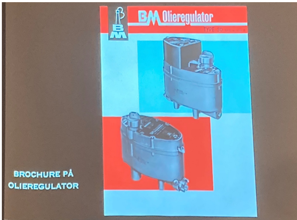
Det helt store produkt for BM